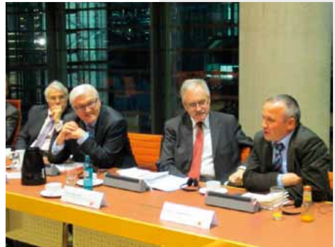
Podiumsdiskussion über „Die pol. Rolle der Türkei“ in Berlin im Februar 2011

Von Entscheidungen war die Rede. Im Dezember verkündete ich meine Entscheidung, 2013 nicht mehr für den Bundestag zu kandidieren. Keine einfache Entscheidung in vielerlei Hinsicht. Ich habe mir diese auch nicht einfach gemacht. Aber dies eröffnet neue Perspektiven für die Nürnberger SPD. Über viele positive Rückmeldungen habe ich mich gefreut. Und jetzt die „Drohung“: es ist ja kein Rückzug aus der Politik. 2012 und 2013 die Grundlagen für einen Wahlerfolg in Berlin und München zu schaffen, bleibt mein Hauptanliegen - wenn auch aus anderer Perspektive. So freue ich mich auf die Zusammenarbeit mit den Ortsvereinen, Verbänden, Institutionen und Vereinen.