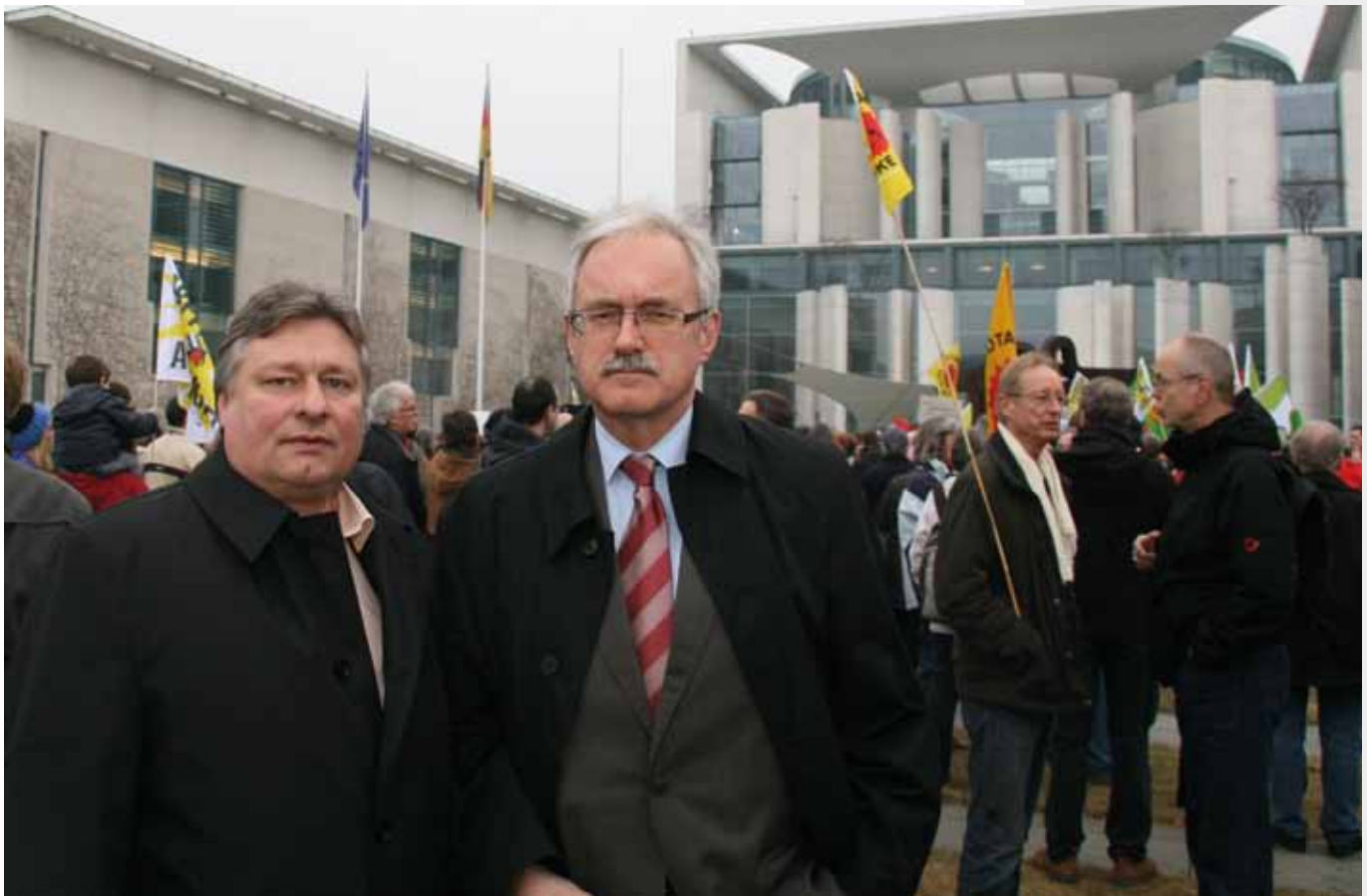
Gemeinsam mit Günter Gloser bei der Anti-Atom-Mahnwache vor dem Bundeskanzleramt

Auch als Vorsitzender der bayerischen SPD-Landesgruppe im Bundestag erfahre ich, welche wichtige Rolle verkehrspolitische Maßnahmen vor Ort spielen. Die Forderung nach Umgehungsstraßen, Ausbau von Bahnstrecken, Umbau von Bahnhöfen und Nutzung von Bahnflächen spielen eine wichtige Rolle.