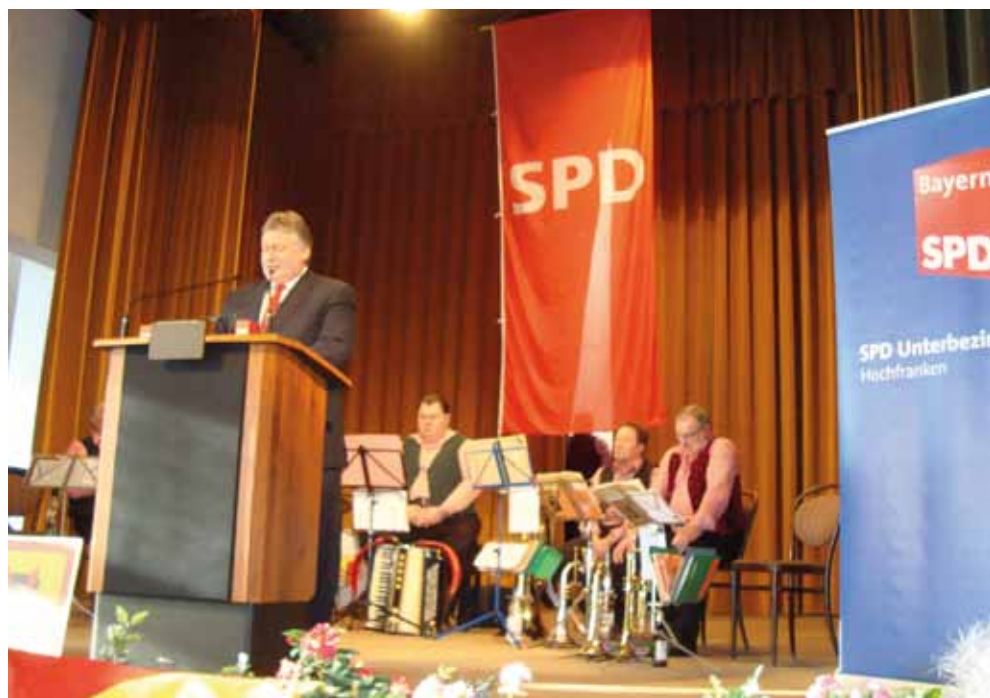
Martin Burkert als Hauptredner beim Neujahrsempfang der SPD Hochfranken in Bad Steben

Wie ich selbst, so haben in vielen Fällen auch meine Mitarbeiterinnen und Mitarbeiter in den Abgeordnetenbüros in Berlin wie in Nürnberg sich um konkrete Anliegen von Bürgerinnen und Bürgern gekümmert, die persönlich vorstellig geworden sind oder sich brieflich oder per E-Mail an mich gewandt hatten. Auch ihnen – und ebenso den Mitarbeitern im Landesgruppenbüro - danke ich für die Unterstützung, ohne die meine vielfältigen Aufgaben nicht zu bewältigen gewesen wären.