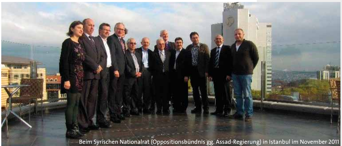
Beim Syrischen Nationalrat (Oppositionsbündnis gg. Assad-Regierung) in Istanbul im November 2011