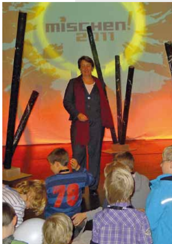
Abmischen Die Gala zum Finale von mischen2011. Mehr Informationen unter: http://www.mischen-mfr.de/