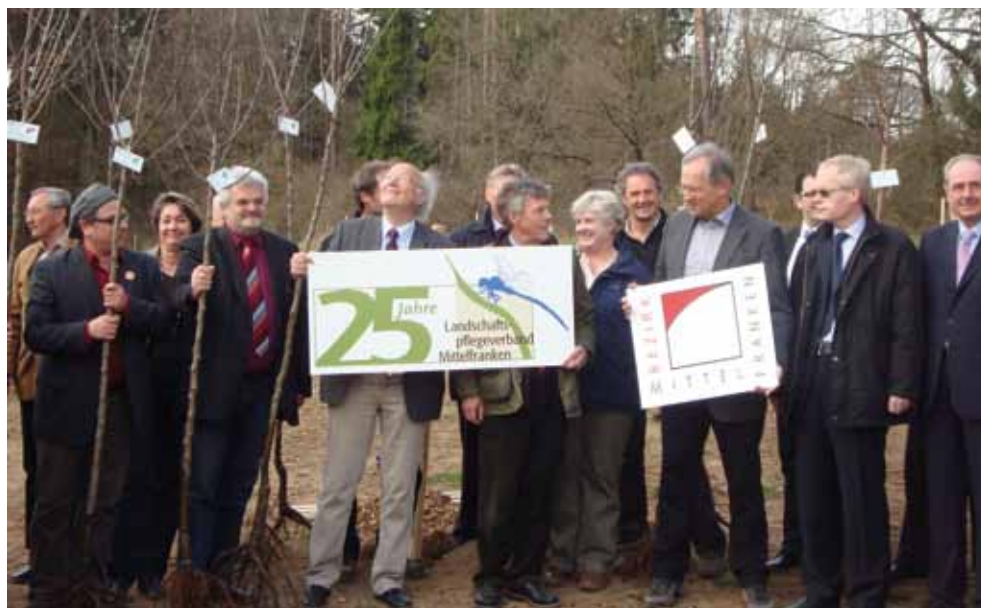
Baumpflanzung anlässlich des 25-jährigen Bestehens des Landschaftspflegeverbandes