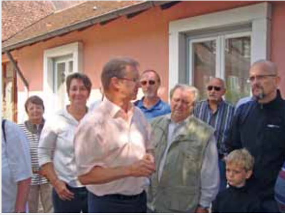
SPD Bezirksräte im Gespräch mit Kleingärtnern

der Ausgaben im Vergleich zu den anderen bayerischen Bezirken. Es werden dabei teilweise Zahlen verschiedener Jahre verglichen. Das Gutachten ist deswegen nur bedingt aussagekräftig. Das Gutachten ist keine Grundlage für die inhaltliche Weiterentwicklung der Eingliederungshilfe.