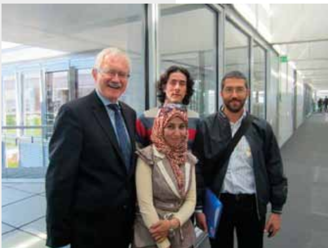
Mit tunesischen und ägyptischen Bloggern in Berlin im Juni 2011

punkt. Die Bundesregierung rief 2011 zum `Jahr der Pflege´ aus – doch das Thema wurde zum Armutszeugnis von Schwarz/Gelb. Geliefert wurde Nichts von Substanz. Im Gegensatz zur SPD-Bundestagsfraktion, welche ein Positionspapier erarbeitete und mit Betroffenen bundesweit diskutierte, um Anregungen aufzunehmen. Das große Interesse an der Fraktion-vor-Ort-Veranstaltung mit Hilde Matheis, MdB im November unterstrich die Bedeutung des Themas.