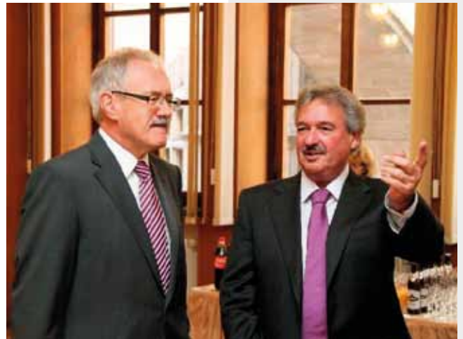
Mit Jean Asselborn, Außenminister Luxemburgs im Nürnberger Rathaus anlässlich des Europa-Empfangs im Mai 2011