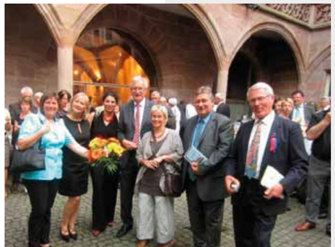
60-jährigen Bestehens des Kreisverbandes Nürnberg der Siebenbürger Sachsen im Rathaus im Juni 2011