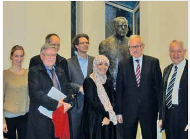
Mit Tawakkul Karman, Friedensnobelpreisträgerin aus Jemen und Mitstreitern in Berlin bei der Friedrich-Ebert-Stiftung im Dezember 2011

Und im Wahlkreis? Neben den genannten Themen stand vor allem die Pflegeversicherung im Mittel-