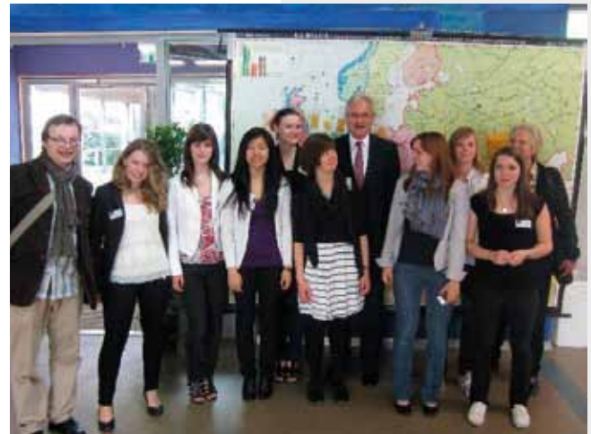
EU-Projekttag am Platen-Gymnasium in Ansbach im Mai 2011