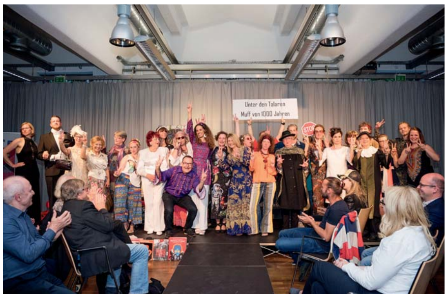
Großer Andrang bei der Mitmach-Modenschau.