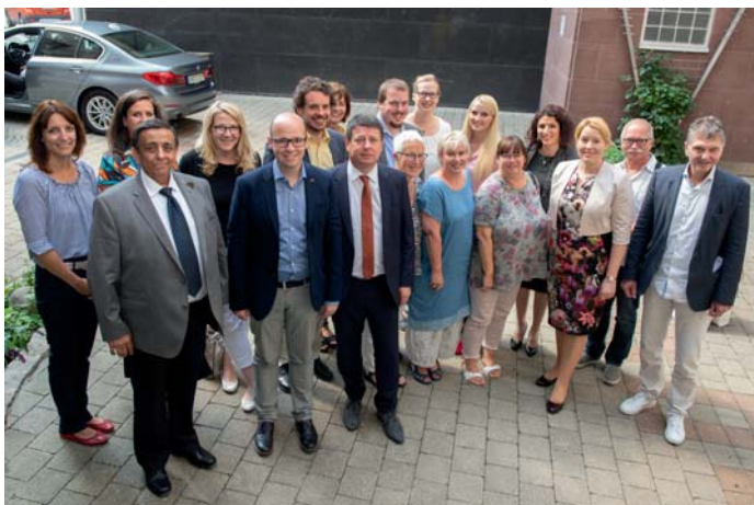
Die Mitglieder der „Allianz gegen Rechtsextremismus“

Von den zusätzlichen Bundesmitteln kann beispielsweise zusätzliches Personal eingestellt und die Kita-Öffnungszeiten ausweitete werden. Gerade in Bayern gibt es in diesen Punkten vielerorts noch Nachholbedarf.