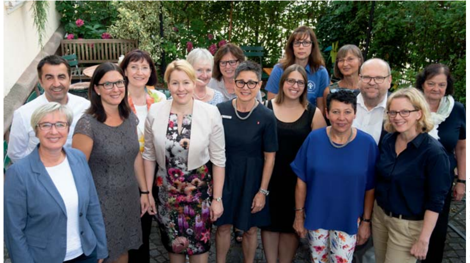
Bei einem gemeinsamen Mittagessen tauschte sich die Ministerin mit Multiplikatoren aus der Familienpolitik in Nürnberg aus.