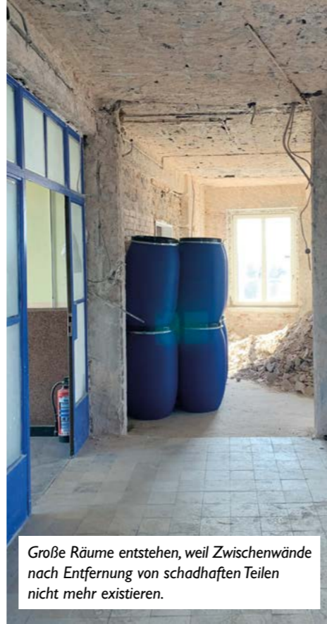
Große Räume entstehen, weil Zwischenwände nach Entfernung von schadhafte Teilen nicht mehr existieren.

damit alle wissen, wo Hürden warten und wie diese umgangen werden können.