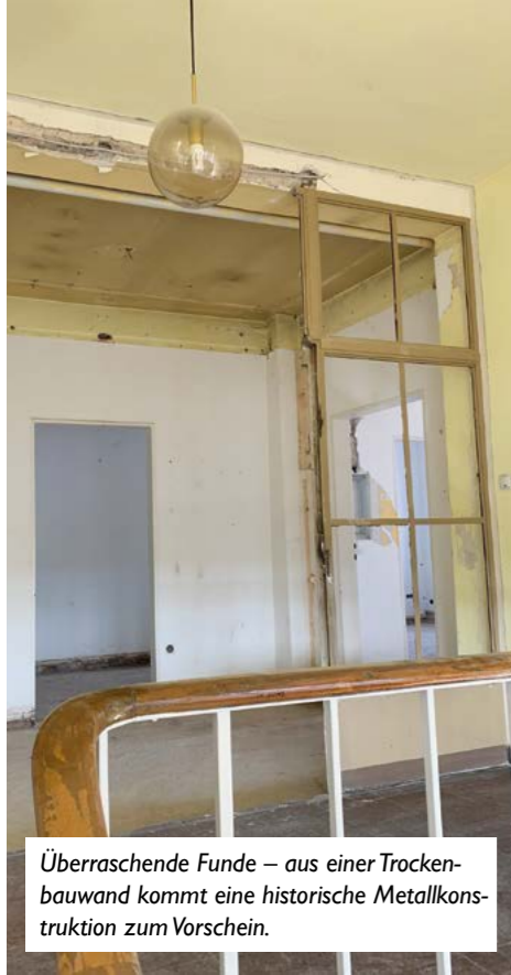
Überraschende Funde – aus einer Trockenbauwand kommt eine historische Metallkonstruktion zum Vorschein.