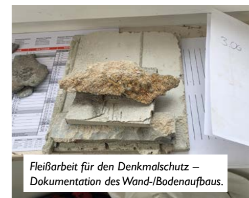
Fleißarbeit für den Denkmalschutz – Dokumentation des Wand-/Bodenaufbaus.