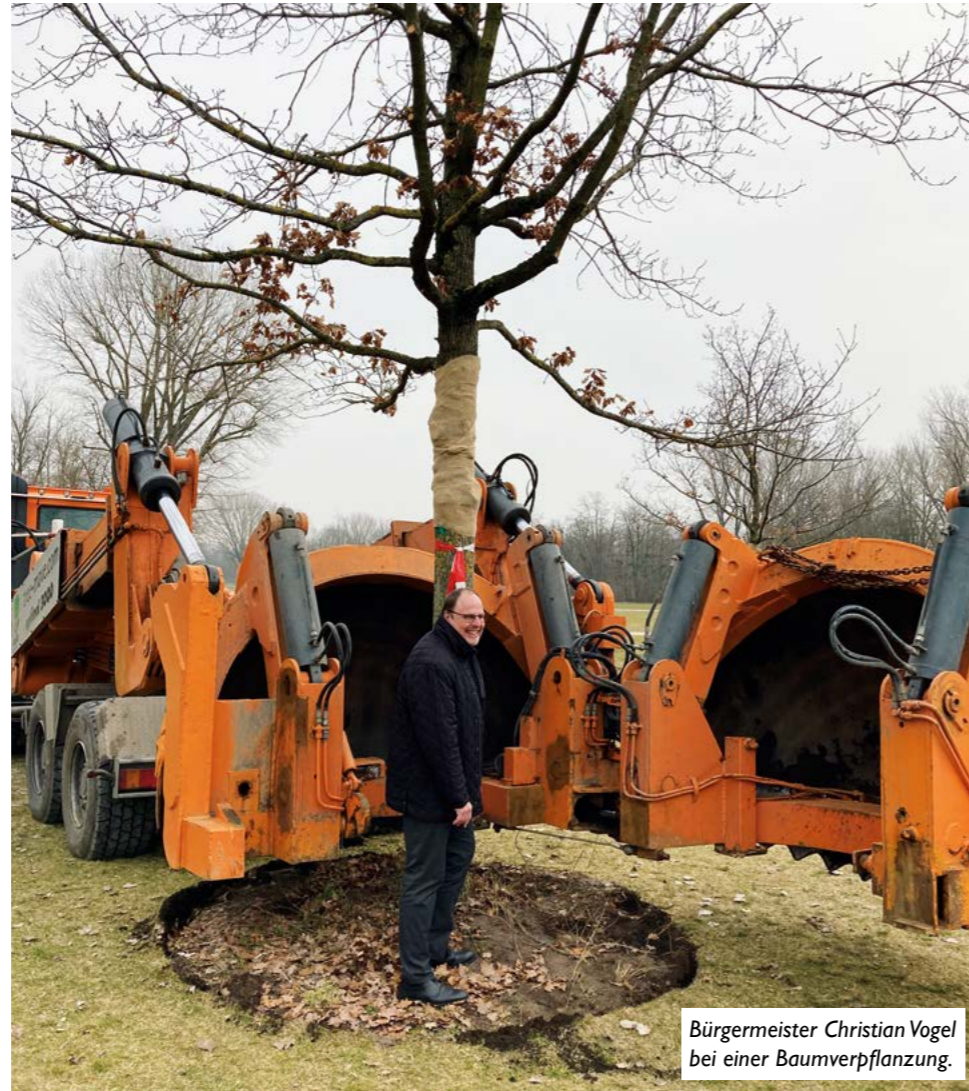
Bürgermeister Christian Vogel bei einer Baumverpflanzung.

Unser Bürgermeister Christian Vogel ist erster Werkleiter des „Servicebetriebs Öffentlicher Raum“ (SÖR) der Stadt und damit für den größten städtischen Eigenbetrieb zuständig. SÖR bearbeitet im Stadtgebiet die Arbeitsbereiche „Orange“ (Straßenreinigung und Winterdienst), „Grün“ (Stadtgrün und Spielplätze) und „Grau“ (Straßen, Brücken und Beleuchtung). Der kürzlich vorgestellte Jahresbericht 2020 verdeutlicht die Vielfältigkeit der Arbeit und die großen Herausforderungen, die die SÖR-Mitarbeitenden in Nürnberg jährlich bewältigen.