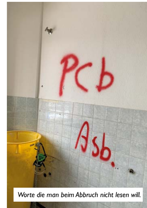
Worte die man beim Abbruch nicht lesen will.