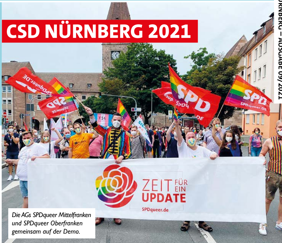
Die AGs SPDqueer Mittelfranken und SPDqueer Oberfranken gemeinsam auf der Demo.

von SEBASTIAN KROPP, AG SPDqueer Oberfranken