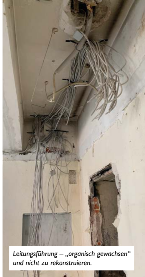
Leitungsführung – „organisch gewachsen“ und nicht zu rekonstruieren.