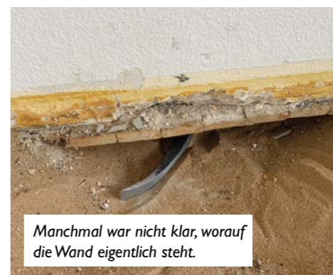
Manchmal war nicht klar, worauf die Wand eigentlich steht.