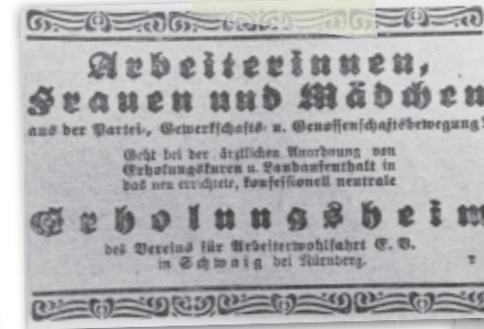
Bericht Fränkischen Tagespost über die Eröffnung des Schwaiger Erholungsheims und eine dazugehörige Anzeige aus dem Jahr 1925