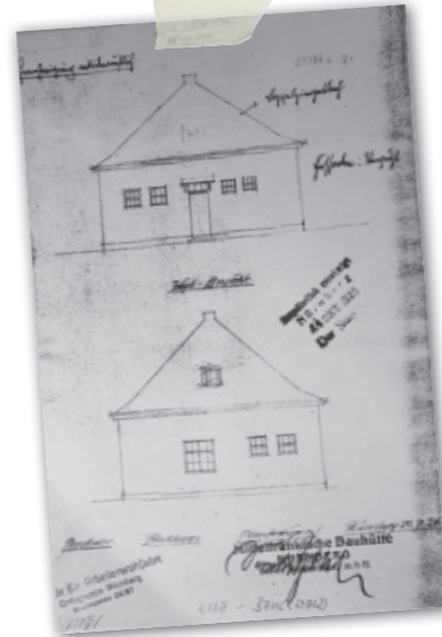
Bauplan für den ersten AWO-Kindergarten in Bayern aus dem Jahr 1926.

Die großen Probleme dieser Zeit lagen also auf der Hand: Hohe Sterblichkeitsraten, vor allem bei Kindern, aufgrund von Hunger und mangelnder Hygiene. Die Arbeiterwohlfahrt half hier entscheidend mit, die Not vieler Menschen in Nürnberg zu lindern. Unter anderem auch durch sehr erfolgreiche Ferientage und mehrtägige Ausflüge, an denen regelmäßig mehrere hundert Kinder teilnahmen: „Ungeachtet des schlechten Wetters trafen sich am letzten Mittwoch über 300 Kinder und 25 Führerinnen in der Siedlung Buchenbühl. Mit frohem Gesang zogen die einzelnen Gruppen hinaus ins Freie. Proletarienkinder mit hohlen Wangen