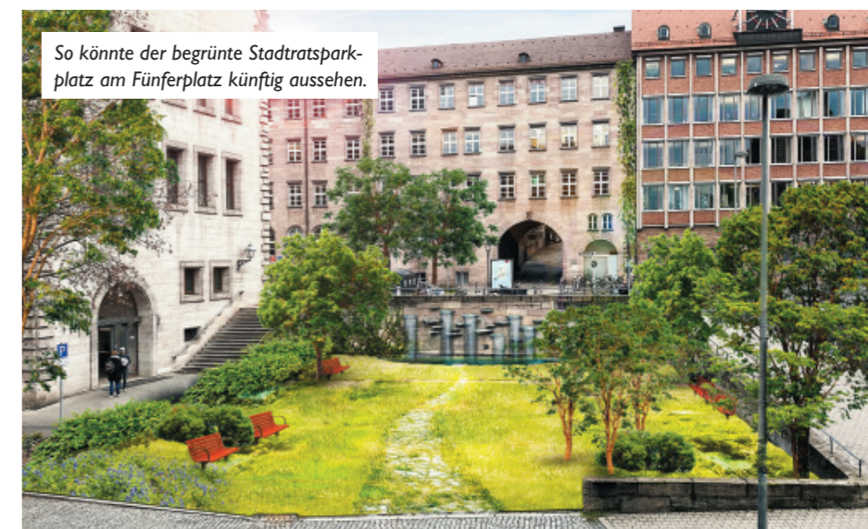
So könnte der begrünte Stadtratsparkplatz am Fünferplatz künftig aussehen.

Verlust aber als tragbar. Auch wir sehen in den überarbeiteten Planungen eine gute Weichenstellung zugunsten einer fußgängerfreundlicheren Innenstadt und einer „Rückgewinnung“ des öffentlichen Raums für die Menschen, statt der Autos. Als Stadträte sollten wir mit gutem Beispiel vorangehen und deshalb schlagen wir vor, den bisherigen Stadtratsparkplatz im Zuge der Umgestaltung des Obstmarktes auch in