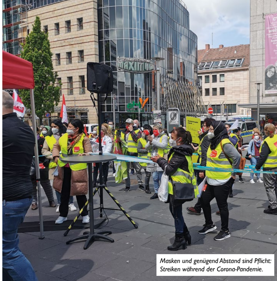
Masken und genügend Abstand sind Pflicht: Streiken während der Corona-Pandemie.

Die SPD ist bereit, um nun mit Kooperationspartner und den anderen Fraktionen den schrittweisen Übergang in den TVöD möglich zu machen. Wir haben vorgelegt und klare Haltung bewiesen. Nun sind andere am Zug und müssen sich im Rathaus auch klar positionieren. Weglächeln wird man den berechtigten Streik der Kolleginnen und Kollegen nicht können.