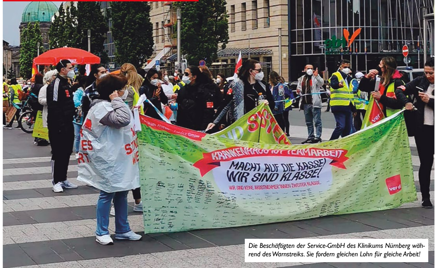
Die Beschäftigten der Service-GmbH des Klinikums Nürnberg während des Warnstreiks. Sie fordern gleichen Lohn für gleiche Arbeit!