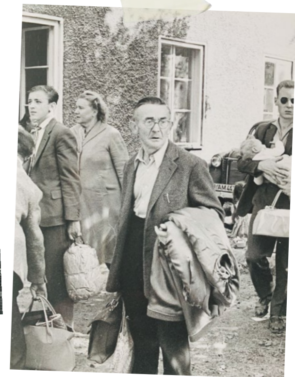
Ankunft von Flüchtlingen in Schafhof.