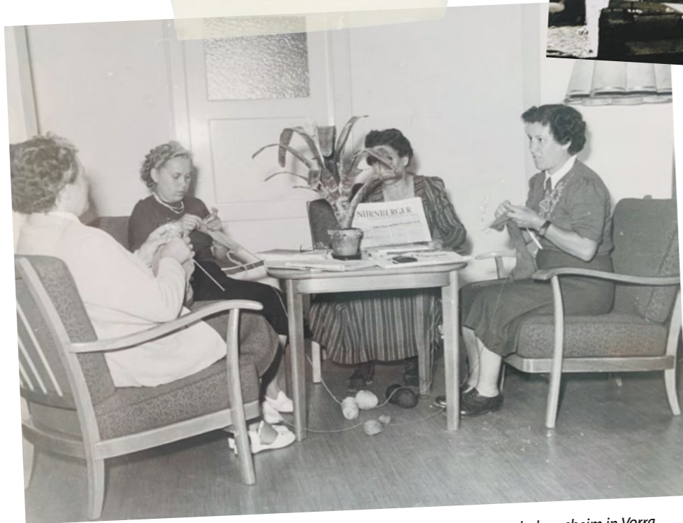
Das Müttererholungsheim in Vorra.

In der Tat – das was die Nürnberger AWO in den ersten Monaten nach Kriegsende auf die Beine gestellt hat, ist mehr als beachtlich. So bot sie zusätzlich zu den Massenspeisungen bald auch regelmäßig Schulspeisungen an. Neben Erholungsangeboten für Kinder gab es bald auch Erholungsfürsorge für Mütter und für Kriegsheimkehrer.