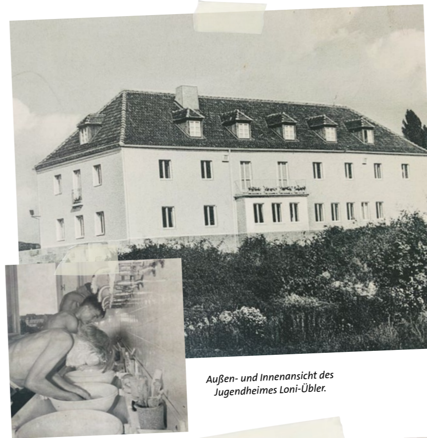
Außen- und Innenansicht des Jugendheimes Loni-Übler.

Ein weiteres Ziel war, Kindern eine erholsame Zeit zu ermöglichen. Auch das wurde schon 1946 umgesetzt. Georg Jareis schreibt dazu: „Die Kinder der Arbeiterwohlfahrt wurden zur Wiederherstellung ihrer vollen Gesundheit und zur Erholung nach Hersbruck, Dinkelsbühl und Geroldshofen geschickt. Um eine Erholung möglichst vielen Kindern zu Teil werden zu lassen, errichtete die Arbeiterwohlfahrt auf dem Feuerstein bei Ebermannstadt ein Zelterholungslager. Dort verbrachten 450 Kinder 4 Wochen in ungebundener Freizeit, jedoch unter Aufsicht von Helferinnen und Helfern. Es konnte bei den zum größten Teil unterernährten Kindern eine sehr erhebliche Gewichtszunahme festgestellt werden.“ Weiter plante die AWO Nürnberg die baldige Eröffnung eines Kindererziehungsheim auf Schloss Rauschenberg bei Dachsbad im Landkreis Neustadt an der Aisch, in dem 80 Kinder Platz haben sollten.