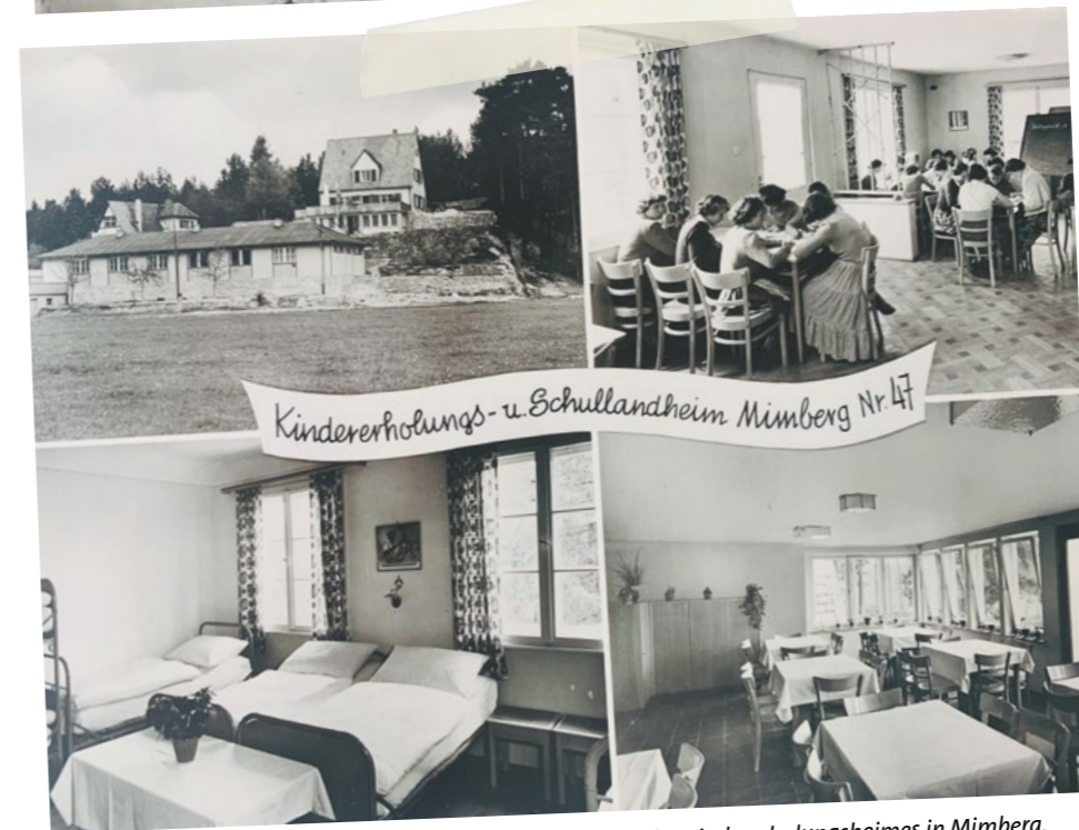
Postkarte des Kindererholungsheimes in Mimberg.