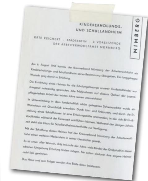
Informationsbroschüre Kindererholungsheim Mimberg