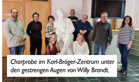
Chorprobe im Karl-Bröger-Zentrum unter den gestrengen Augen von Willy Brandt.

Wir bauen Stück für Stück ein Repertoire auf, das die Tradition der Arbeiterlieder und demokratischen Volkslieder verbindet mit modernen und internationalen Songs, frechen Rhythmen und coolen Grooves – Musik und Chorgesang als Widerspiegelung gesellschaftlicher Verhältnisse früher und heute. Wenig bekannt ist übrigens, dass das „Singen der Lieder der deutschen Arbeiterbewegung“ 2014 von der UNESCO zum immateriellen Kulturgut erklärt wurden, u.a. mit der Begründung, dass Arbeiterlieder als gelebte Volkskultur von großer Bedeutung für den Zusammenhalt der Völker und das Streben nach Frieden sind.