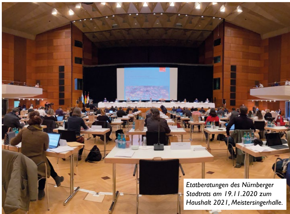
Etatberatungen des Nürnberger Stadtrats am 19.11.2020 zum Haushalt 2021, Meistersingerhalle.

Der Stadtrat hat in seiner Sitzung am 19. November 2020 den Haushalt der Stadt Nürnberg für das Jahr 2021 beschlossen. Nach den zugehörigen Etatberatungen, die aufgrund der Corona-Pandemie in der Nürnberger Meistersingerhalle stattfanden, stimmte der Stadtrat mit großer Mehrheit dem Haushaltsentwurf zu. Für uns als SPD ist klar: Nürnberg ist eine liebens- und lebenswerte Stadt. Sie wird es auch nach Corona sein. Stark macht uns die gelungene Balance aus gesellschaftlichem Zusammenhalt, ökologischer Nachhaltigkeit und wirtschaftlichem Erfolg. Diese drei Erfolgssäulen stützt nun auch der Haushalt für das Jahr 2021, auch wenn die Stadt wegen der starken Corona-Finanzeinbußen, an vielen Stel-