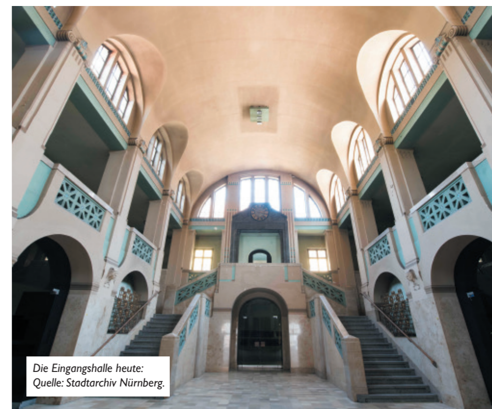
Die Eingangshalle heute:

1914 wurde das Volksbad eröffnet. Zur Verbesserung der hygienischen Verhältnisse in