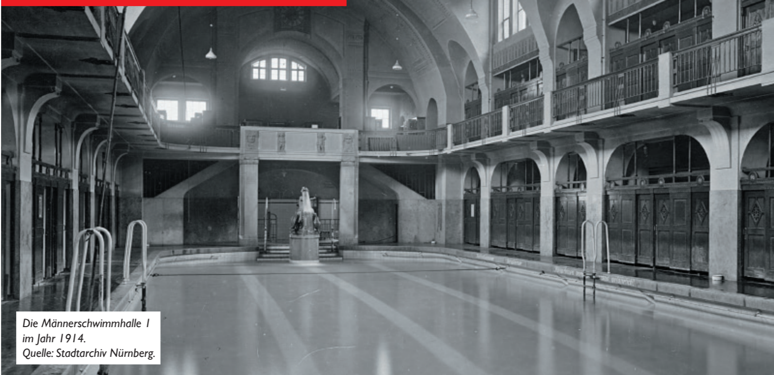
Die Männerschwimmhalle I im Jahr 1914.

> 1.12.2019 – Matinee – 11.00 bis ca. 12.30 Buchvorstellung „So schmeckt Heimat!“ Ein außergewöhnlichen Kochbuch - Der „Verein Wohngemeinschaft für unbegleitete minderjährige Flüchtlinge“ hat ein Kochprojekt mit jungen Flüchtlingen durchgeführt. Daraus ist ein „Kochbuch“ der besonderen Art entstanden. Wir laden Sie ein mit Asma aus Somalia „SAMBUSA“ (Teigtaschen mit Hackfleisch-Füllung) zu probieren und eine äthiopische Kaffezeremonie mit Fre zu erleben. Die jungen Flüchtlinge freuen sich aus Sie! Eintritt frei