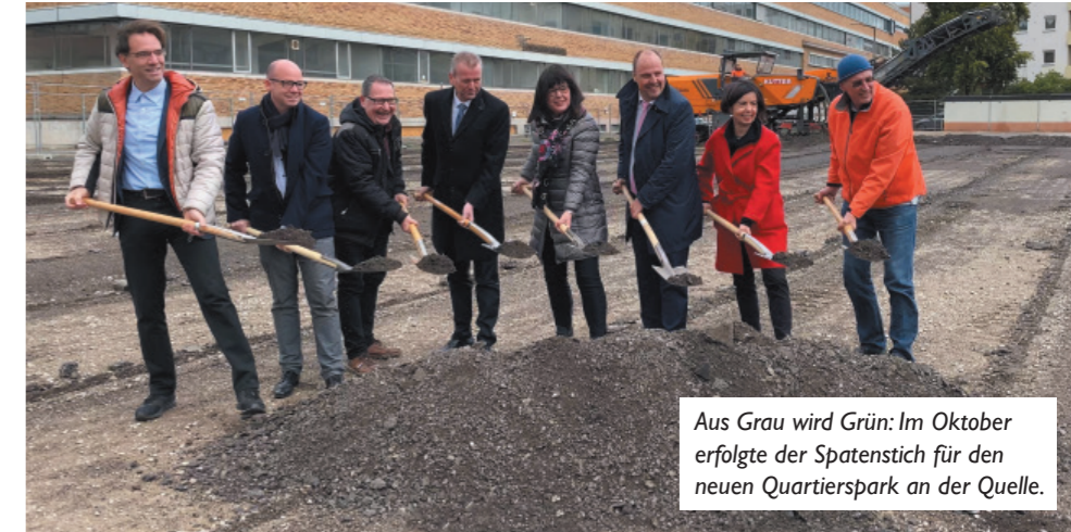
Aus Grau wird Grün: Im Oktober erfolgte der Spatenstich für den neuen Quartierspark an der Quelle.

Rund 60 Besucherinnen und Besucher nutzten die Einladung zur SPD-Business-Lounge, um sich über die Entwicklungen im und um das Quelle-Areal zu informieren. Dort entsteht demnächst ein neuer Stadtteil mit rund 1.000 Wohnungen, neuen geförderten Wohnungen, kleinen Läden und Geschäften. Auch das neue „Sozialrathaus“ der Stadt mit Jugend- und Sozialamt wird dort Platz finden. Der entsprechende Mietvertrag wurde kürzlich unterzeichnet. Bisher sind diese Ämter noch auf verschiedene Gebäude aufgeteilt, die zum Teil schon sehr in die Jahre gekommen sind. Für rund 1.000 städtische Mitarbeiter werden damit neue attraktive Räumlichkeiten auf rund 42.000 qm entstehen. Der Ämterkomplex wird im nördlichen Teil der Quelle in Richtung Fürther Straße liegen und mit dem U-Bahnhof Eberhardshof über eine sehr gute öffentliche Verkehrserreichung verfügen. Während es im Quellegebäude nächstes Jahr losgehen soll und die Fertigstellung für 2024 angepeilt wird, erfolgte der Spatenstich für den neuen Quartierspark in Eberhardshof bereits im Oktober. Auf dem ehemaligen Quelle-Busparkplatz