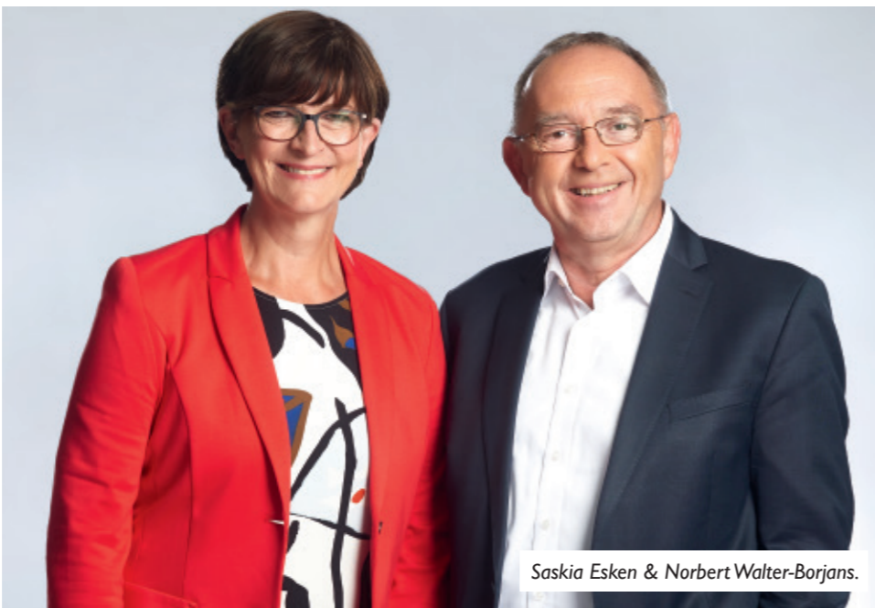
Saskia Esken & Norbert Walter-Borjans.