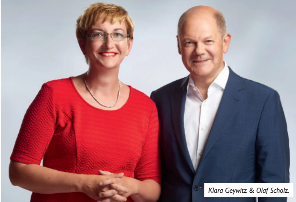
Klara Geywitz & Olaf Scholz.

Wer vor der Abstimmung nochmal genauer nachlesen möchte, wofür die beiden Teams genau stehen, findet weiterführende Informationen unter www.unsere.spd.de