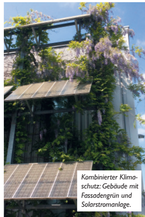
Kombinierter Klimaschutz: Gebäude mit Fassadengrün und Solarstromanlage.