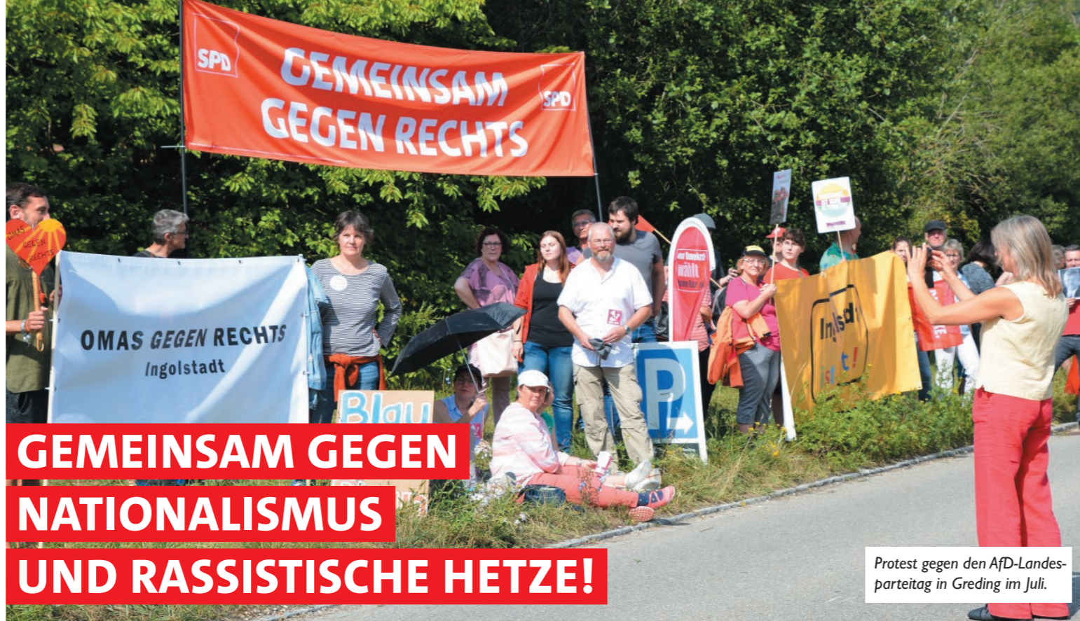
Protest gegen den AfD-Landesparteitag in Greding im Juli.

> Ein Kind wird auf dem Frankfurter Hauptbahnhof brutal ermordet, der Täter ist ein Migrant. Auf den gleichen Seiten im Netz ergießt sich nun der Hass ausnahmslos gegen alle Flüchtlinge, gegen alle Ausländer. Die Forderung, sie „alle abzuschieben“ ist noch eine der harmloseren Äußerungen, die man lesen konnte. Gleichzeitig wurden und werden Drohungen gegen Menschen, die sich für Flüchtlinge einsetzen, ausgestoßen, Drohbriefe verschickt mit Morddrohungen. An drei Tagen hintereinander führen nacheinander AfD, die extrem rechten „Gelbwesten“ um einen ehemaligen NPD-Funktionär