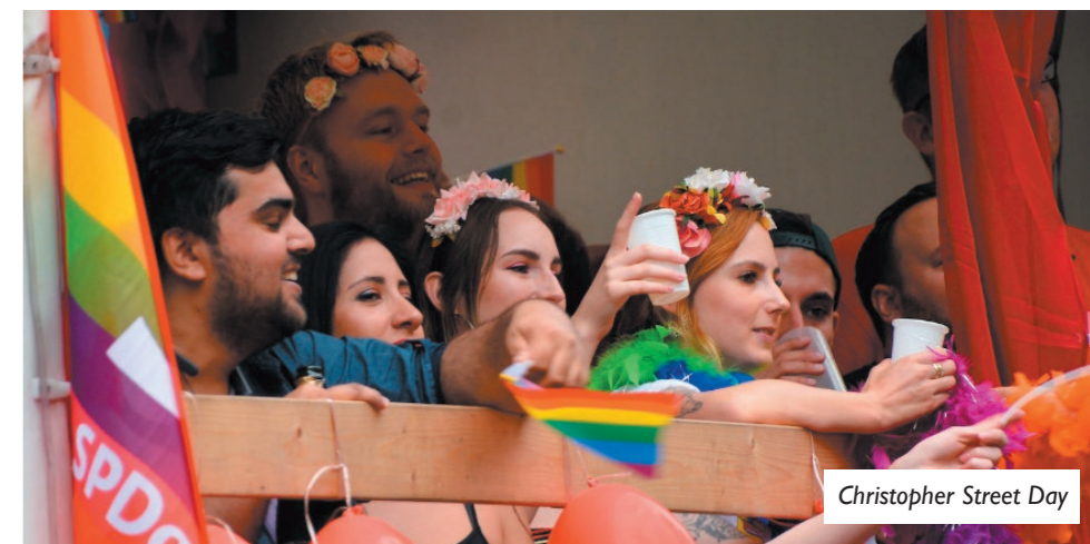
Christopher Street Day