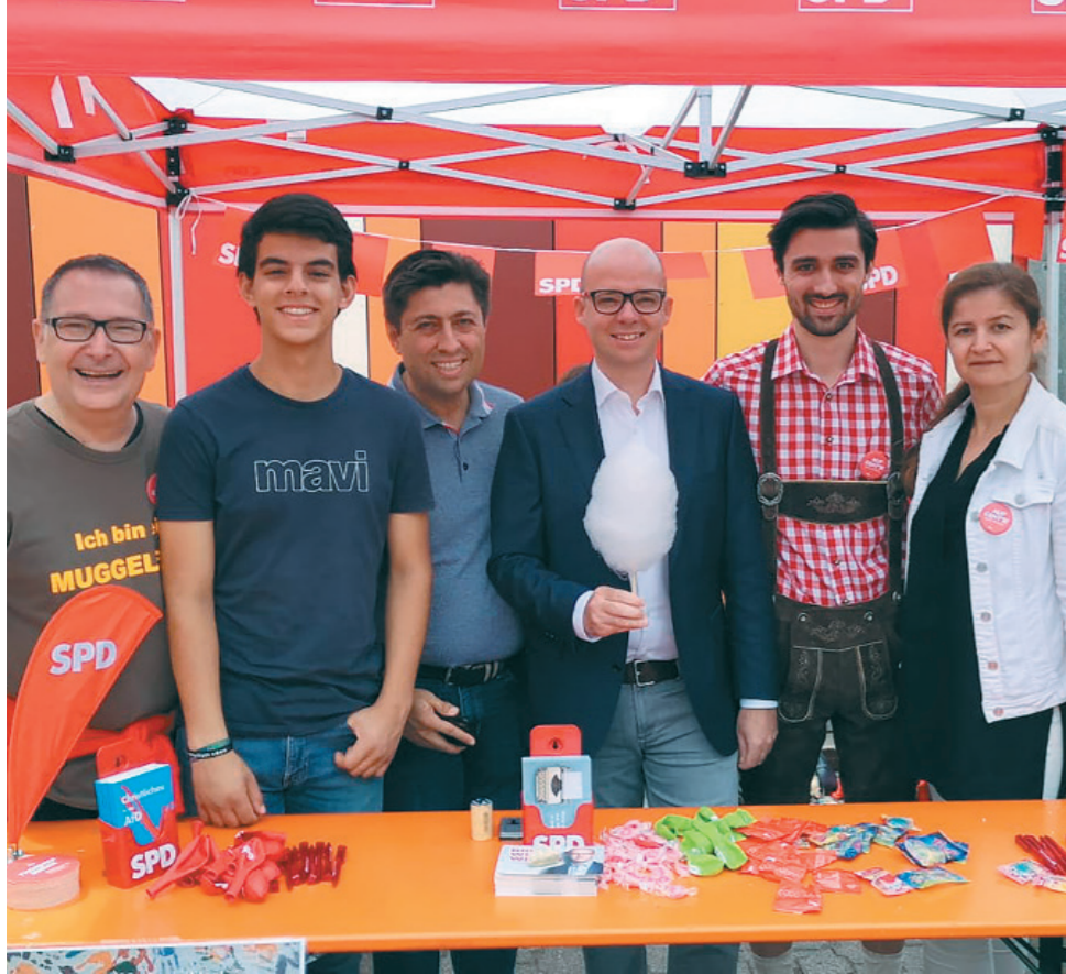
von SPD MUGGENHOF-DOOS

Jeder Stadtteil hat seine Feste. So findet in vielen Stadtteilen eine Kärwa über mehrere Tage statt, mit traditionellem Kärwa-Umzug. In Nürnbergs wilden Westen gibt es jedoch keine Kärwa, dafür aber ein Stadtteilst. Dieses Jahr fand das Muggeley Stadtteilstfest bereits zum 11. Mal statt. Und jedes Jahr wird dieses größer und lockt