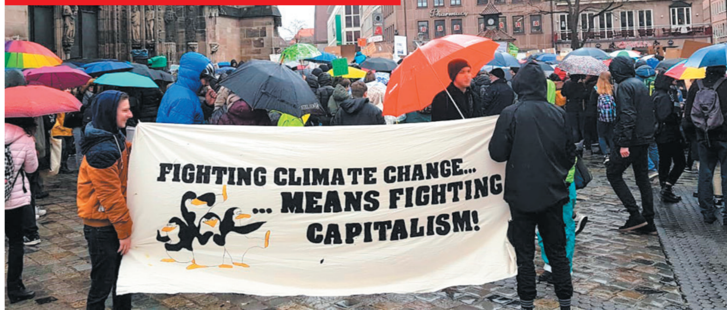
von LINDA REINKE

Die Klimaerwärmung steht schon länger auf der politischen Agenda, ehrgeizige Ziele wurden gesteckt, um den Klimawandel zumindest zu begrenzen. Hätte Deutschland dieses Jahr vorgehabt, die Pariser Klimaziele doch noch zu erreichen, hätten wir bereits am 28. März den gesteckten CO 2 -Grenzwert überschritten. Während umweltschädliche Industrien immer noch stark subventioniert werden, sind es vor allem die sozial Schwachen, die unmittelbar von den Folgen der Umweltverschmutzung und Klimakrise getroffen werden.