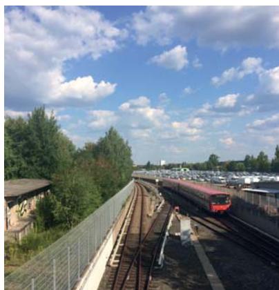
An der Brunecker Straße soll ein Zukunftscampus entstehen

und optimale stadtentwicklerische und städtebauliche Rahmenbedingungen zu schaffen. Deshalb muss