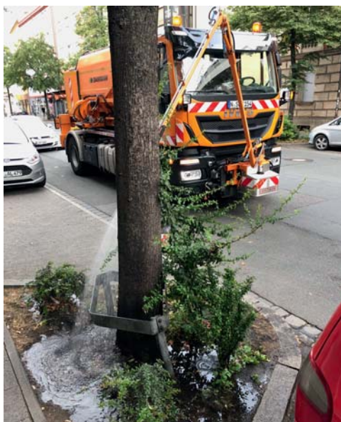
Baumgießer-Fahrzeug von SÖR

2017 hat SÖR zusätzlich zu den rund 80.000 Bäumen der Stadt 247 neue gepflanzt, 103 ersetzt und 117 gefällt: ein Plus von 233 Bäumen. Auch die Baumpatenschaften haben um 80 auf 985 zugelegt, wodurch 1.384 Bäume betreut wurden, 125 mehr als 2016. Zusätzlich gingen Baumspenden in Höhe von 103.800 Euro ein, womit 58 Bäume gepflanzt und 10 am Stamm geschützt wurden. Etwa 1 % des Bestands ist noch durch den Hitzesommer 2015 geschädigt. Und auch für die Folgejahre rechnet SÖR mit Baumsterben. Der lange, heiße und trockene Sommer 2018