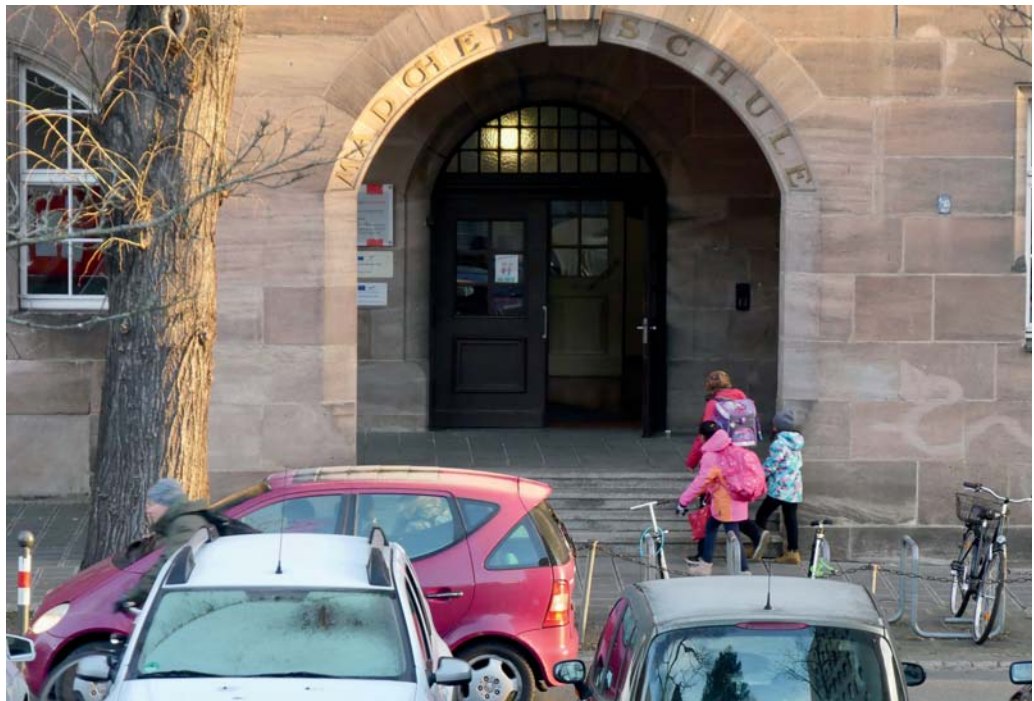
Ein rotes „Elterntaxi“ hält direkt vor dem Eingang zur Reutersbrunnenschule

Um nun die Verkehrssicherheit vor den Schulgebäuden zu erhöhen und unvernünftiges Halten und Parken im unmittelbaren Schulbereich zu verhindern, hat die SPD-Fraktion zusammen mit CSU, FDP und Grünen einen gemeinsamen Antrag eingebracht: Demnach prüft die