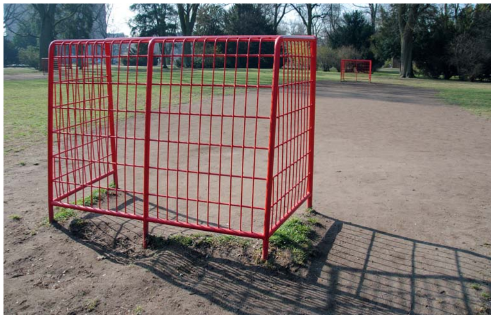
Viele Bolzplätze sind inzwischen in die Jahre gekommen. Für deren Sanierung nimmt die Stadt nun viel Geld in die Hand.

Das Thema Freiräume für junge Menschen in einer wachsenden Stadt, die immer dichter besiedelt wird, bleibt ein Dauerbrenner. Bei jeder Jugendversammlung werden wir auf den Zustand der Fußball- oder Basketballplätze angesprochen. Desffhalb ist es äußerst erfreulich, dass die Verwaltung nun in einer Art „Masterplan“