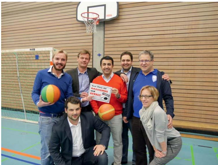
Erfolgreich in Sachen Integration durch Sport: Das Team des Projekts „Bunter Sport“ der SpVgg Roth.

Wir alle wissen, welche befreiende Wirkung Sport hat. Sport bringt Menschen zusammen. Sport schafft Erfolgserlebnisse. Sport