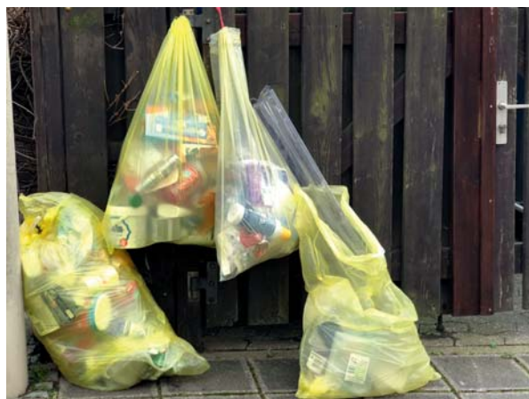
Gelbe Säcke sind dünnhäutig, reißen leicht auf und können Gehweg und Straße vermüllen

ren Städten gibt es Gelbe Tonnen anstatt Gelber Säcke.