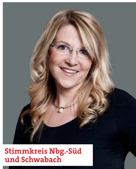
Stimmkreis Nbg.-Süd und Schwabach

Ich möchte dazu beitragen, diese und andere Themen voranzubringen mit dem Ziel ein friedliches und solidarisches Zusammenleben in unseren Kommunen zu sichern. Es sind die Themen der „kleinen Leute“, die wir ernst nehmen und derer wir uns annehmen müssen. Deshalb braucht es eine starke SPD im Bayerischen Landtag. Wir brauchen keine CSU, die immer weiter nach rechts rückt und ihre schwarze Null über alles andere stellt. Dafür möchte ich kämpfen, engagiert und nah an der Basis, sowie an den Bürgern.