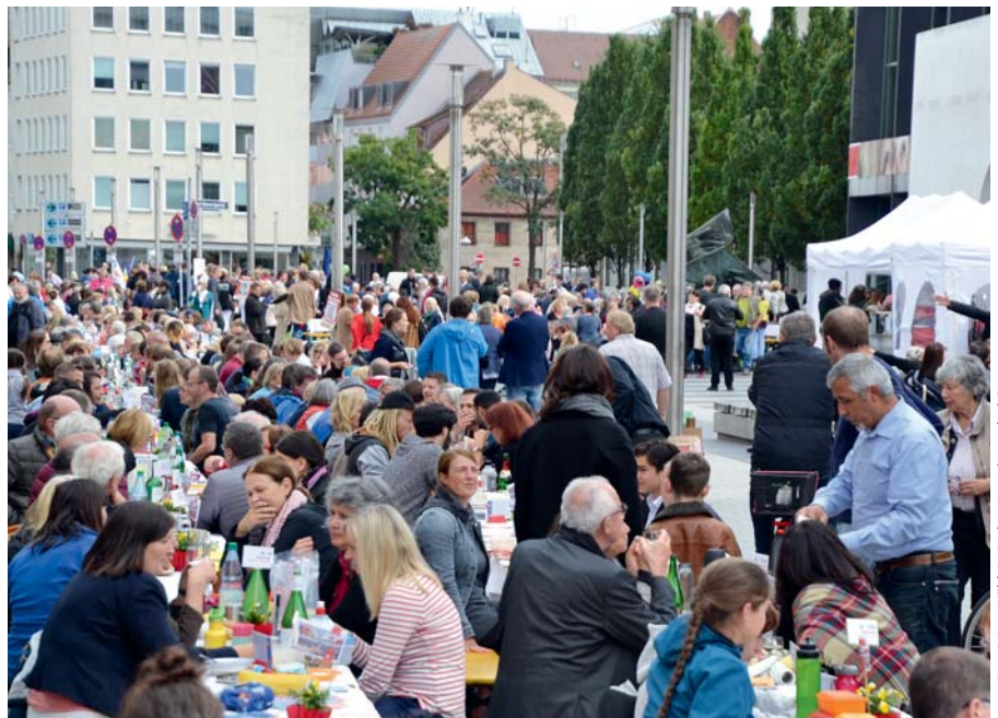
Die Friedenstafel auf dem Kornmarkt

VON MARTINA MITTENHUBER UND DR. ULRICH MALY