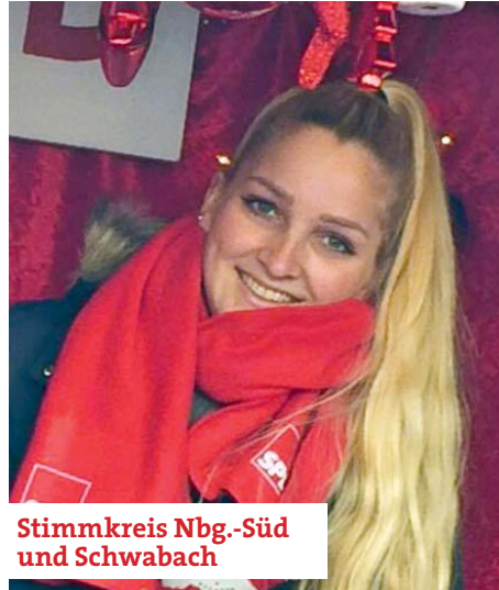
Stimmkreis Nbg.-Süd und Schwabach

Motivation: Der Bezirk verfügt über einen hohen Etat, der von der Politik zu wenig kontrolliert wird. Gerade im Bereich Psychiatrie liegt auch bei der Behandlung einiges im Argen. Mein Vorteil ist, dass ich mich in den Zuständigkeitsfeldern des Bezirks als Rechtsanwalt und Vertreter von Betroffenen beruflich auskenne, ohne Lobbyinteressen zu vertreten, mit Ausnahme der Lobby der BürgerInnen und Betroffenen. Wir müssen das Geld im Interesse der Betroffenen ausgeben und uns nicht den Wünschen der Lobbyisten beugen. Wer keine Unterstützung wünscht, muss nicht „zwangsbeglückt“ werden. Mein Motto im Sozialbereich lautet: „Unterstützen ohne Bevormunden“.