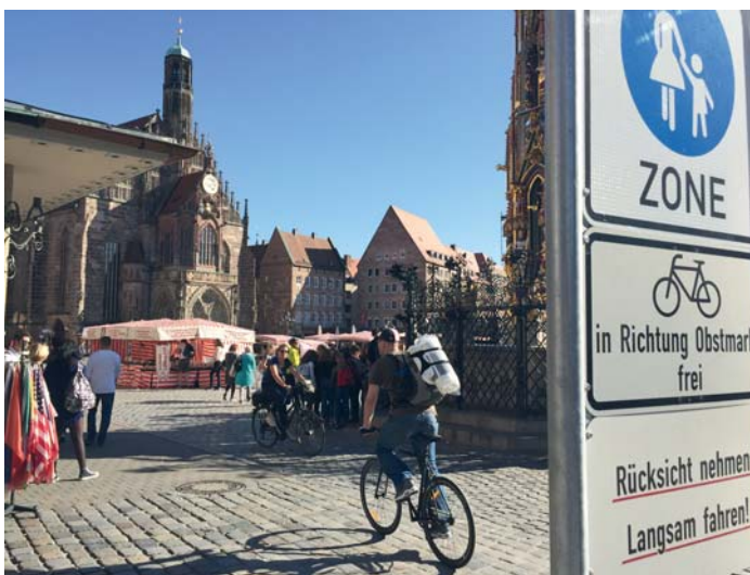
Radler dürfen den Hauptmarkt am nördlichen Abschnitt queren

nung des Hauptmarkts für den Radverkehr, um Rad-Berufspendler zwischen Nürnbergs Osten und Westen eine bessere Anbindung zu geben; diese wurde von den Stadträten im September beschlossen, nachdem