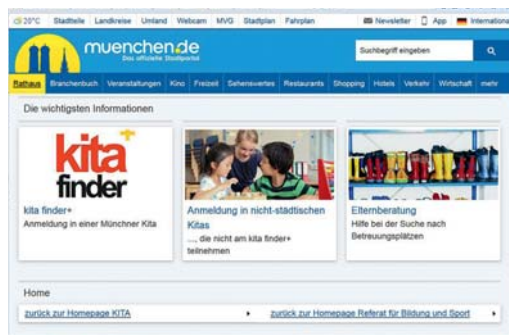
Die Münchner haben ihr Kita-Portal schon

stütztes System zur Suche, Vergabe und Verwaltung von Kinderbetreuungsplätzen. Das Portal soll träger-