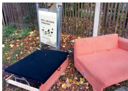
Ecke Adam-Klein- / Kernstraße in Gostenhof

Die Fraktion hat sich auch immer gegen eine „Bewaffnung“ der Mitarbeiter ausgesprochen, wie sie manchmal von der CSU ins Spiel gebracht