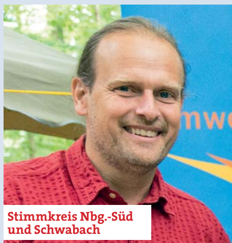
Stimmkreis Nbg.-Süd und Schwabach

Ich wohne und arbeite seit vielen Jahren im Stimmkreis und freue mich, die Belange der Menschen im Nürnberger Süden vertreten zu dürfen.