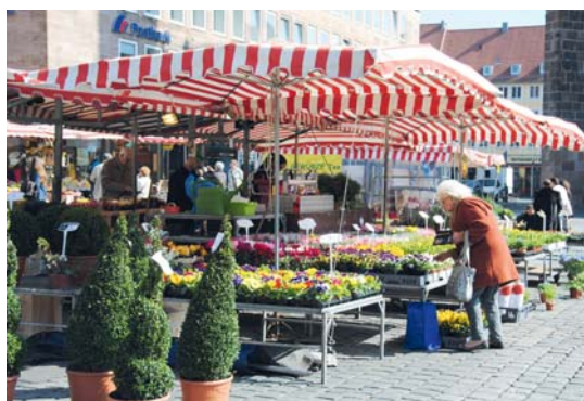
Die Verkaufsstände auf dem Hauptmarkt bekommen zwar gute Noten, trotzdem wünschen sich viele Kunden einen noch attraktiveren Wochenmarkt.

stände mindestens einmal pro Woche aufsuchen – den 48 Markthändlern