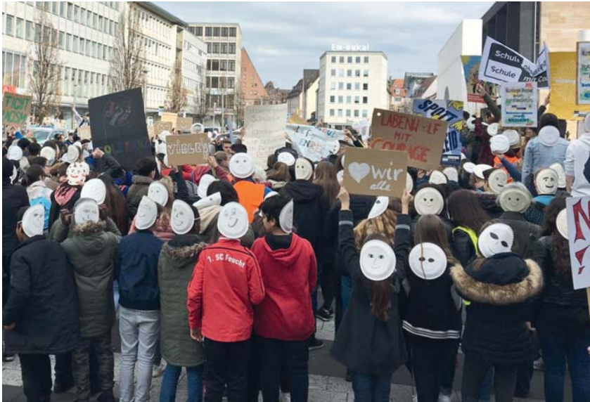
Sternmarsch Nürnberger Schülerinnen und Schüler von ihren Schulen zur Straße der Menschenrechte

setzten ein Zeichen gegen Rassismus, Diskriminierung und Verletzung der Menschenwürde.