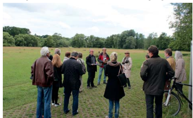
Die SPD-Fraktion informiert sich vor Ort über die Planungen für ein Naturschutzgebiet

Erholung als auch ein schützenswerter Lebensraum für gefährdete Pflanzen- und Tierarten bleibt. Insgesamt wurden im Laufe der vergangenen 30