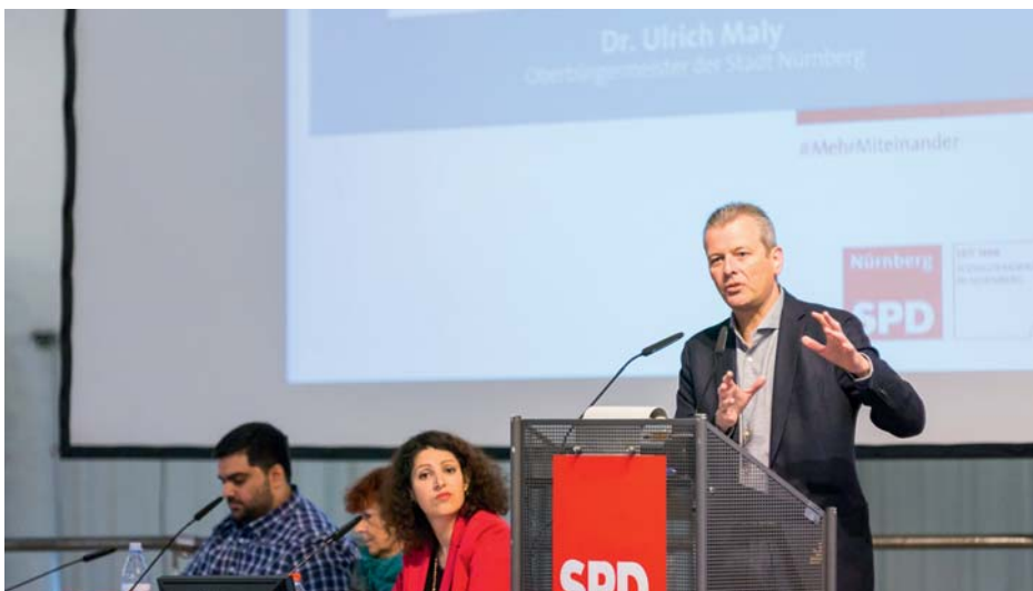
OB Uli Maly schwor die Delegierten bei seinem alljährlichen Grußwort auf den bevorstehenden Wahlkampf ein.