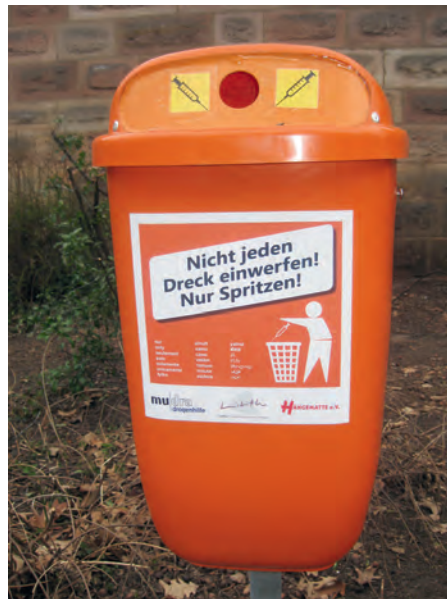
Spritzenentsorgungsbehälter für gebrauchte Spritzen an der Königstorpassage