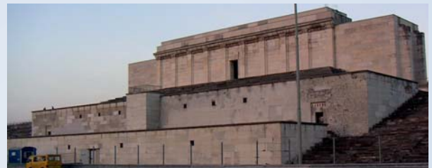
Die Steintribüne im Jahr 2004, Foto: Stefan Wagner

Lern- und Erfahrungsort Zeppelinfeld – Sanieren, trittfest machen oder verfallen lassen?