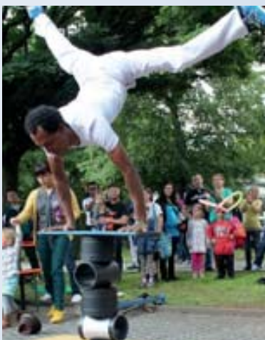
Spiele - Vorführungen - Tombola

Am 26. September 2015 von 13 bis 18 Uhr im Behindertenzentrum Boxdorf - Am Spund 4