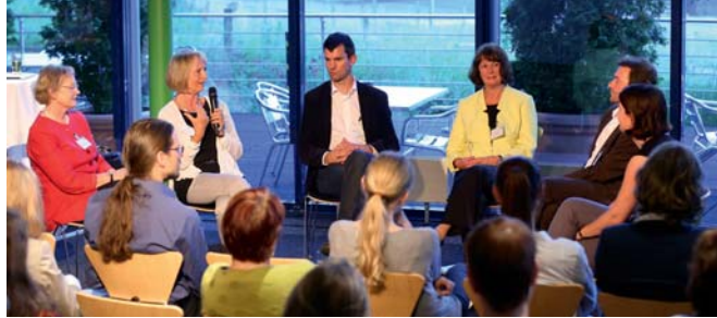
Diskussionsrunde im Rahmen der eff-Veranstaltung zum Thema „neue Väter“ bei der DATEV eG.

nun Frauen mitreden und sie sich auch noch selbst darum kümmern sollen, dass genau das passiert. Hilfestellungen könnten zum Beispiel Schulungs- und Coaching-Angebote sein, Datenbanken, die potenzielle Kandidatinnen sichtbar