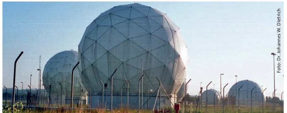
Bad Aibling Station - wurde hier Wirtschaftsspionage betrieben?

Der Bundesnachrichtendienst (BND) soll dem US-Geheimdienst NSA über Jahre hinweg möglicherweise unwissentlich geholfen haben, europäische Unternehmen und Politiker auszuforschen. Dazu soll die NSA dem BND Listen mit Tausenden Suchwörtern (Selektoren) übermittelt haben. Das Parlamentarische Kontrollgremium und der NSA-Un-