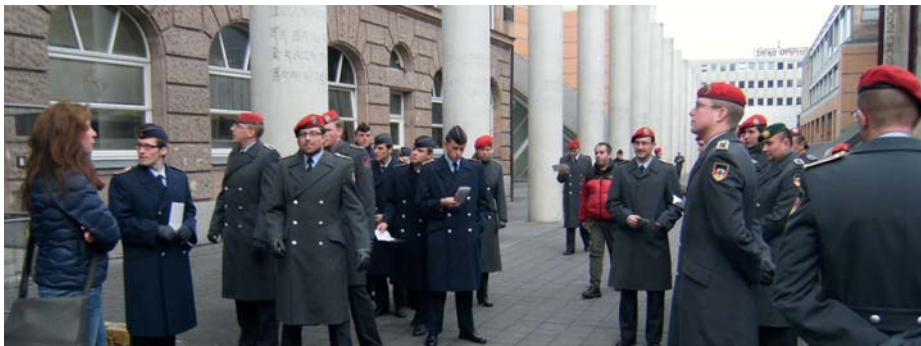
Seminar zur Menschenrechtsbildung in der Straße der Menschenrechte mit Angehörigen der Bundeswehr