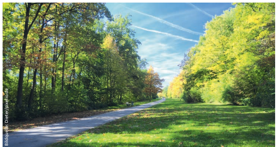
Sauber ist er ein Idyll: der Marienbergpark

Achten wir aber alle gemeinsam auf „unsere“ Grünflächen, sammeln unseren Müll