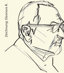
Zeichnung: Eleonore R.

Ein Blick auf die Wirtschaftsdaten der kleinen Schwester verbietet jeden Zweifel. Das eine oder andere Ergebnis lässt Nürnberg ganz schön alt aussehen. Jetzt ist sowieso alles klar. Wer redet noch von Bayern und München, vom Club ganz zu schweigen. Meisterschaft und Champions-League werden künftig am Ronhof entschieden.