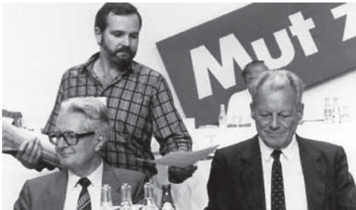
Bundesparteitag in Nürnberg.