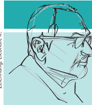
Zeichnung: Eleonore R.

Die Gefahren, die Deutschland vom rechten Terrorismus her drohen, sind unabsehbar – der Kampf dagegen ist vorrangige Aufgabe der staatlichen Institutionen (und auch der Zivilgesellschaft). Das vom Grundgesetz zu Verfügung gestellte Instrumentarium bedarf der Überprüfung und auch der Optimierung im Hinblick auf die antifaschistische Zielsetzung. Im Vorfeld der Strafverfolgungsbehörden kommen dem Verfassungsschutz wichtige nachrichtendienstliche Aufgaben zu. Ob dazu Einsatz von V-Leuten überhaupt noch sinnvoll und vertretbar ist, erscheint sehr zweifelhaft. Zur offenen wie verdeckten